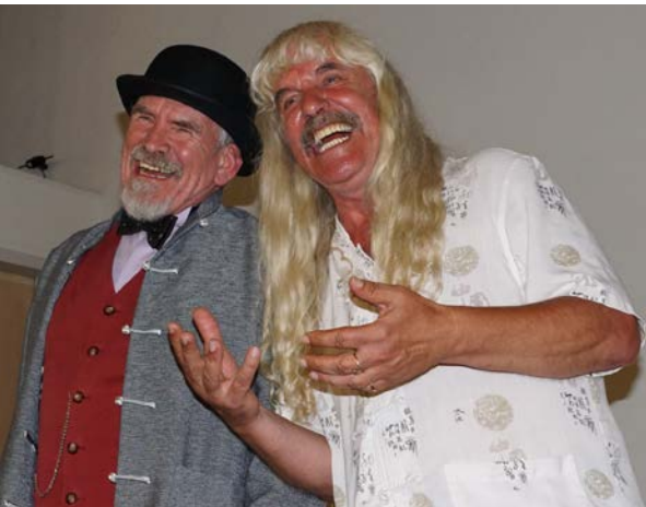
Art View 02:

Künstler von PARADOX laden ein zur Vernissage – im Hintergrund Bilder aus China