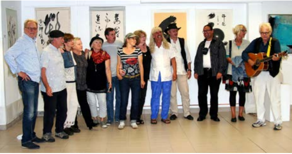
Art View 01:

Künstler von PARADOX laden ein zur Vernissage – im Hintergrund Bilder aus China